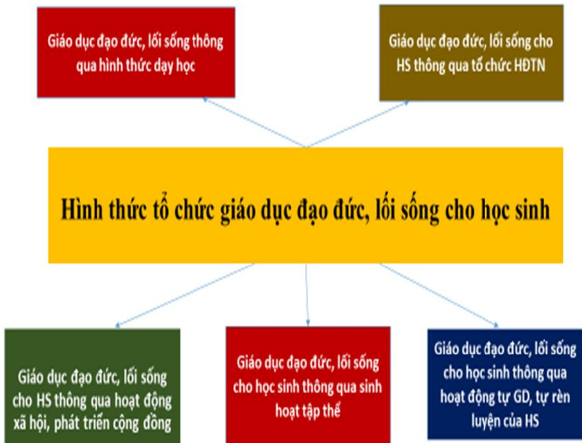
Hình 4: Hình thức giáo dục đạo đức, lối sống cho học sinh

g) Hình thức tự giáo dục, tự rèn luyện của học sinh ở trường, ở gia đình và ngoài cộng đồng là hình thức ảnh hưởng có tính chất quyết định kết quả của quá trình giáo dục đạo đức, lối sống của nhà trường, gia đình và cộng đồng vì vậy những tác động giáo dục của nhà trường, thầy cô, những tác động giáo dục của gia đình, tác động giáo dục của các lực lượng xã hội phải đi đến hình thành được ở học sinh tính tự giác, tích cực, tự tập luyện, rèn luyện phẩm chất đạo đức, lối sống ở học sinh. Hiệu trưởng cần chỉ đạo giáo viên phối hợp giữa nhà trường, gia đình và cộng đồng phát huy tính tự giác, tích cực, chủ động của học sinh trong hoạt động tự giáo dục, tự rèn luyện, tăng cường môi trường trải nghiệm để học sinh có cơ hội thể hiện tính tự giác, tích cực tập luyện, rèn luyện phẩm chất đạo đức, lối sống.