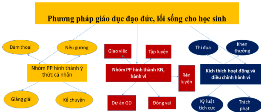
Hình 3: Phương pháp giáo dục đạo đức, lối sống cho học sinh

Phương pháp “giáo dục kỷ luật tích cực” là hệ phương pháp phản ánh quan điểm giáo dục tích cực, mô hình giáo dục học sinh trong và bằng hoạt động của học sinh, thông qua đó giáo viên giúp học sinh thay đổi, điều chỉnh hành vi, hình thành, phát triển hành vi mới hoặc phòng ngừa những hành vi tiêu cực có thể xảy ra. Tính mục đích của phương pháp kỷ luật tích cực trong trường học là: Thay đổi hành vi và thói quen chưa tốt đã hình thành ở học sinh; Kích thích điều chỉnh hành vi đã hình thành ở học sinh nhằm đạt chuẩn về hành vi theo yêu cầu giáo dục; Hình thành hành vi và thói quen mới theo yêu cầu của nhà trường, gia đình và xã hội; Phòng ngừa những hành vi tiêu cực ở học sinh và loại bỏ trừng phạt học sinh trong nhà trường.