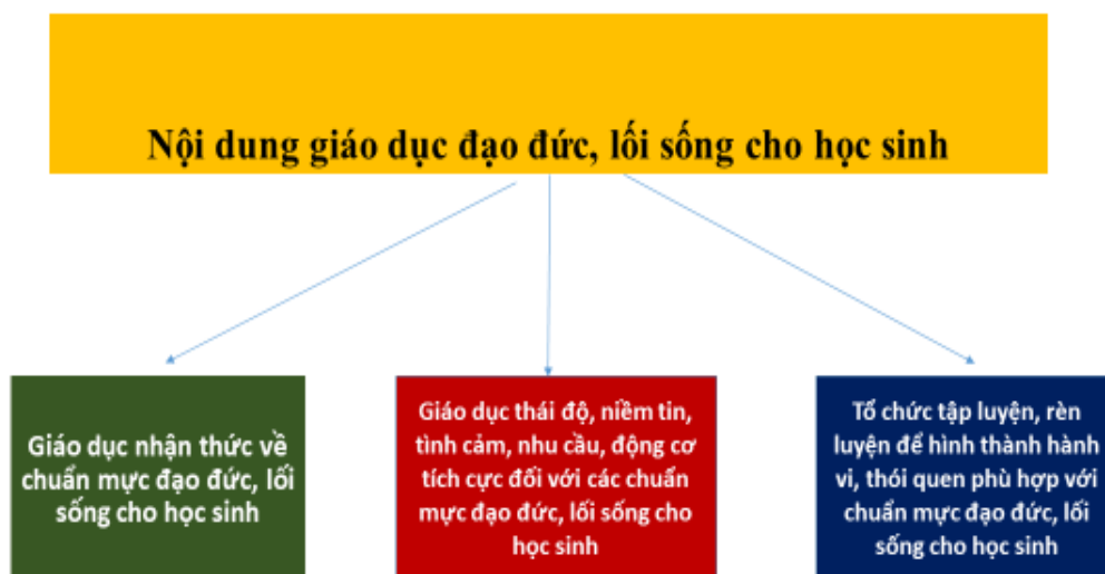
Hình 2: Nội dung giáo dục đạo đức, lối sống cho học sinh

Lứa tuổi của học sinh THCS là lứa tuổi các em học sinh trong giai đoạn dậy thì, các em tò mò và có nhu cầu khám phá cái mới, cái lạ và có nhu cầu cao tham gia vào các mối quan hệ để khẳng định bản thân nhưng lại chưa đủ kinh nghiệm sống trong quá trình thực hiện. Do đó cần quan tâm đến giáo dục tính tự lập, tự chủ trong học tập, thực hiện quyền, bổn phận của học sinh: (+) Tự chủ, tự lập trong quan hệ công việc và quan hệ xã hội, khả năng kiểm chế và kiểm soát cảm xúc cá nhân, tự nhận thức về bản thân và làm chủ cảm xúc trong mọi tình huống để ứng xử phù hợp. Đặc biệt là giáo dục các em làm chủ cảm xúc khi gặp thất bại (sự việc hoặc kết quả khôn như mong đợi, ý muốn của các em) hay chưa thành công trong học tập, quan hệ xã hội, trong hoạt động trải nghiệm; Giáo dục các em biết tự nhận thức, đánh giá để học thông qua sai lầm, coi sai lầm là một bài học và thực hiện quyền và nghĩa vụ của người học; (+) Giáo dục học sinh kỹ năng thích ứng, kỹ năng phản biện xã hội khi tham gia vào các mối quan hệ xã hội, đặc biệt là tham gia mạng xã hội, chấp hành pháp luật về an ninh mạng.